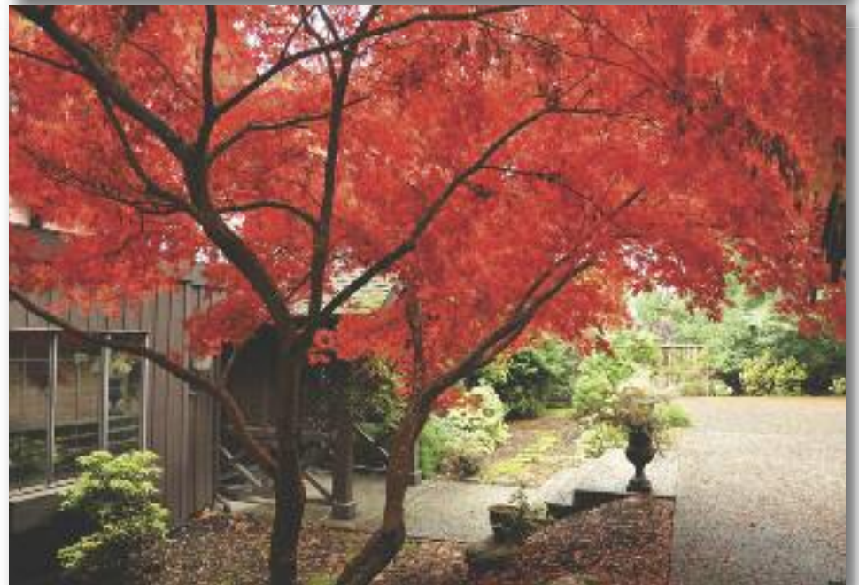
Осень на острове Ванкувер.