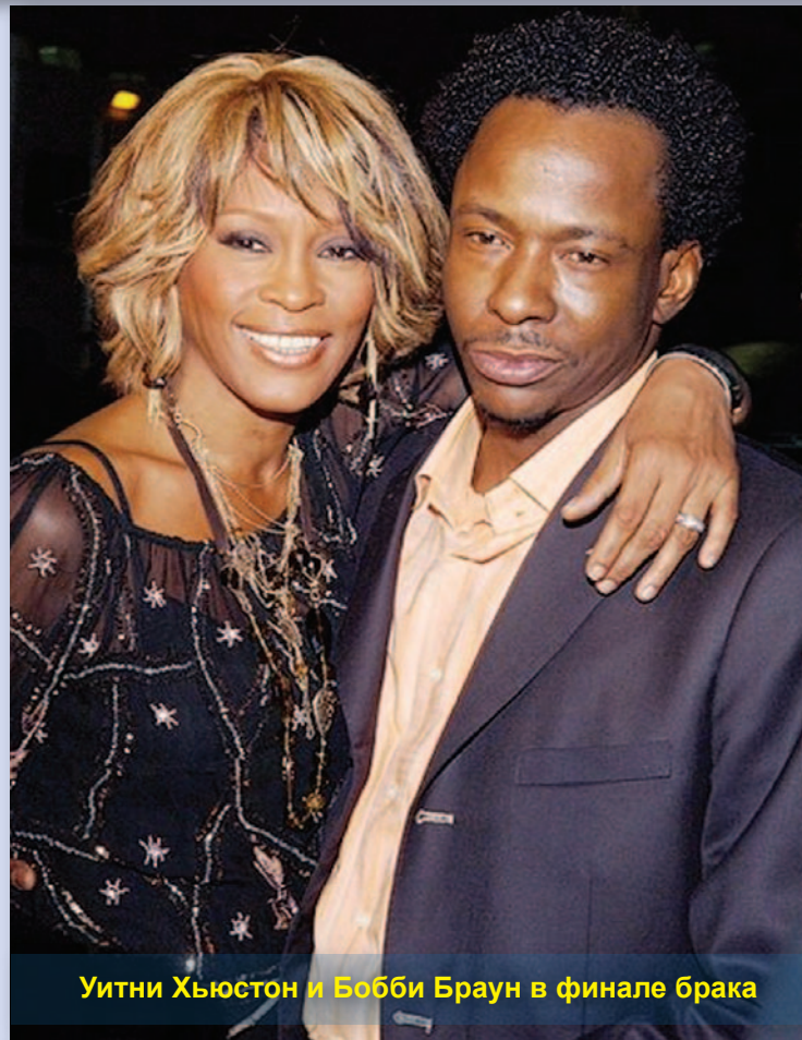
Уитни Хьюстон и Бобби Браун в финале брака

По разным данным, не Бобби Браун первым подсадил Уитни на наркотики. Пристрастие к наркотикам у нее было и до их